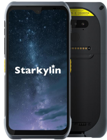
iData T2 标准版