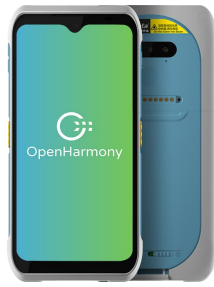
iData T2HC 医疗版