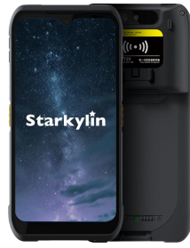
iData T2X 便携式 RFID