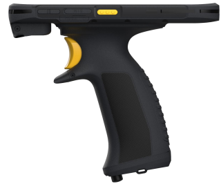
iData T2G 把枪式