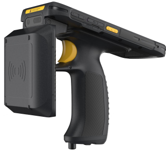
iData T2UHF UHF RFID