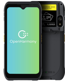
iData T2D 身份证识别